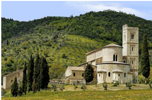
Abtei von Sant' Antimo

PREIS- UND PROGRAMMÄNDERUNGEN VORBEHALTEN