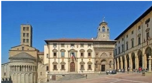
Innenstadt von Arezzo