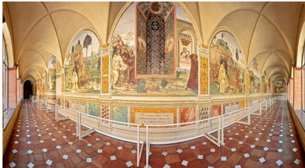
Freskenzyklus im Kreuzgang von Monte Oliveto Maggiore

Die Umgebung lädt zu Ausflügen ein und besticht durch ihre reizvollen Landstriche genauso wie durch die kulturgeschichtlich bedeutsamen Orte, wie die von Papst Pius II. geplante „Idealstadt der Renaissance“ Pienza, die pittoresken Weinorte wie etwa Montalcino oder Montepulciano sowie die beeindruckenden sakralen Kunstwerke von Sant' Antimo oder Arezzo.